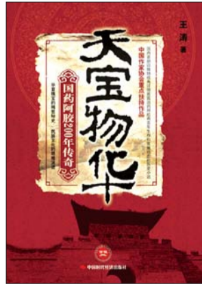
《天宝物华》 王涛 著 中国时代经济出版社 2012年8月出版

“人在胶中”,这是书中屡屡写到的一个神秘意象。我读《天宝物华》,也时时出现幻觉:那些人,男人女人,大人小人,古人今人,好人坏人,都聚集在一件方正正的物品中,展现多彩人生,宣示无常命运。