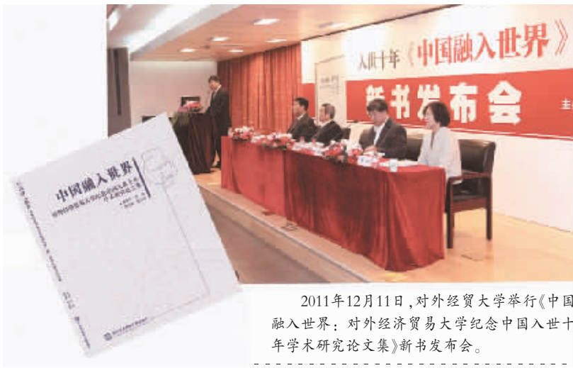
2011年12月11日，对外经贸大学举行《中国融入世界：对外经济贸易大学纪念中国入世十年学术论文集》新书发布会。

近年来，学校教育教学改革不断深化，人才培养质量明显提升。成功申报国家和北京市精品课程25门，国家和北京市优秀教学团队13个，国家级双语教学示范课程8门。获得40个国家级质量工程项目，112个北京市级质量工程项目。学校不断创新人才培养模式，推进“荣誉学士学位项目”和学制改革，人才培养质量明显提升，社会知晓度和国际影