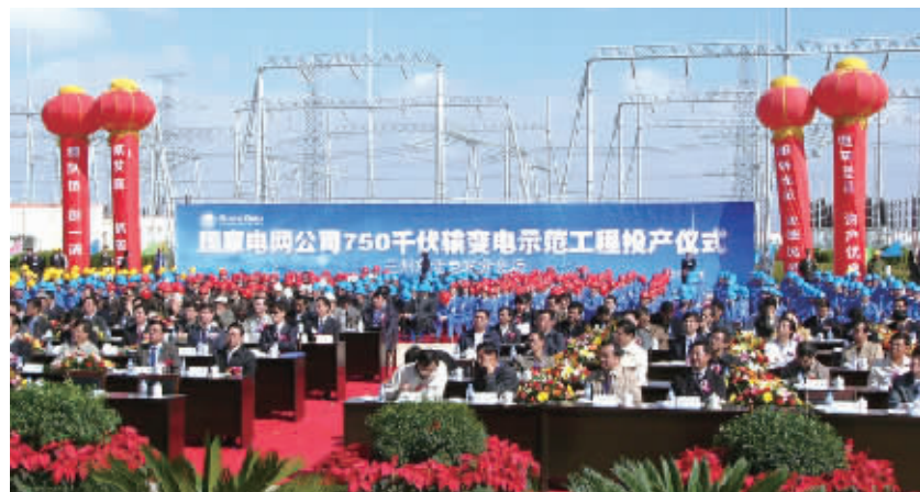
学校与电力企业合作开展科技创新，在节能减排、西电东送等国家重大建设中发挥了重要作用。

引进急需人才、培育未来人才”，启动“创新人才支持计划”、“杰出人才引进计划”，坚持“个别引进”与“团队引进”并举，延揽了一批冲击学科前沿、驰骋学科高地的重量级领军人物和精英人才，培养和引进了一批“千人计划”获得者、“长江学者”、“国家杰出青年基金获得者”、“中科院百人计划”等高层次人才，积极推进青年教师“博士化、国际化、工程化”建设工程，营造人才成长的良好环境，为学校发展提供了坚实的智力资源保障。