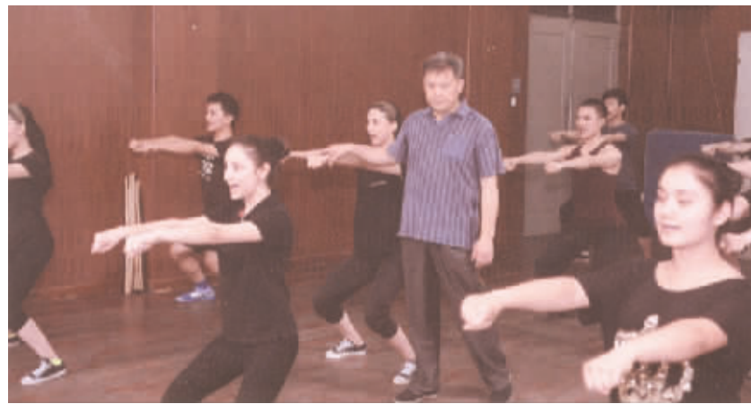
中央戏剧学院表演系精品课“台词”课堂。

内外高层次人才引进渠道。通过建立特聘教授制度，引进具有尖端学术和教学能力的学科带头人；引进若干具有国际学术水平和艺术造诣的艺术大师，不断加大具有国际化教育背景的教师比例，适度扩大聘任长期外籍专家和教授的比例。