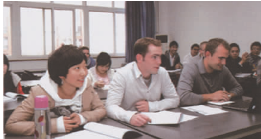
中国政法大学中欧法学院学生在课堂上。

2008年9月17日，教育部正式批准设立中国政法大学中欧法学院。10月23日，成立庆典在学校昌平校区隆重举行。中共中央政治局常委、国务院副总理李克强和欧盟委员会主席巴罗佐莅临庆典并致辞。四年来，来自欧盟13所名牌大学