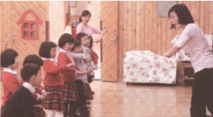
中央音乐学院学生在成都市金苹果新蒙特梭利幼稚园开展实验教学。

多年来，学校一直遵循“开阔的学术视野，广泛的对外交流”这一基本的办学原则，十分重视国际音乐文化交流工作，聘请国际著名音乐家担任名誉教