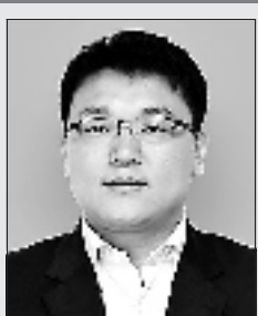
王鹏飞,男,汉族,1980年9月生,群众,大学本科,北京灵动快拍信息技术有限公司首席执行官。他白手起家创办中国最大手机社交网站,目前专注于基于条形码、二维码核心技术的产品及行业解决方案,旗下产品“快拍二维码”用户规模已突破1500万。曾获得中国接力新锐创新奖、新锐人物奖等荣誉称号。